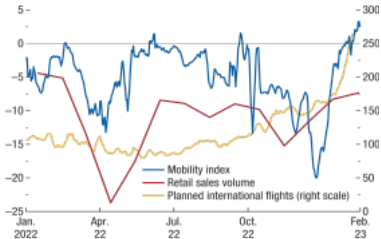
Figure 1.10. China's Reopening and Recovery (Percent deviation from trend; right scale is international flights a day)